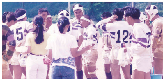
▲医学生時代の西日本ラグビー大会。ハーフタイムの円陣で仲間を鼓舞する筆者。主将で臨んだ4回生時、気合を示すため高校球児よろしく丸刈りで臨んだが……。ラグビー界では受け入れられず、冷笑された(髪の毛も頭部を守る立派な防御機能)。

昨年までのコロナ禍で中止となった学生の大会は多い。特に、春の甲子園大会中止のニュースには、当事者たちの気持ちを考えて我がことのように胸が痛んだ。戦時以来、初めてという。日常が戻った昨今、学生諸君には密な青春が送れることを願って止まない。